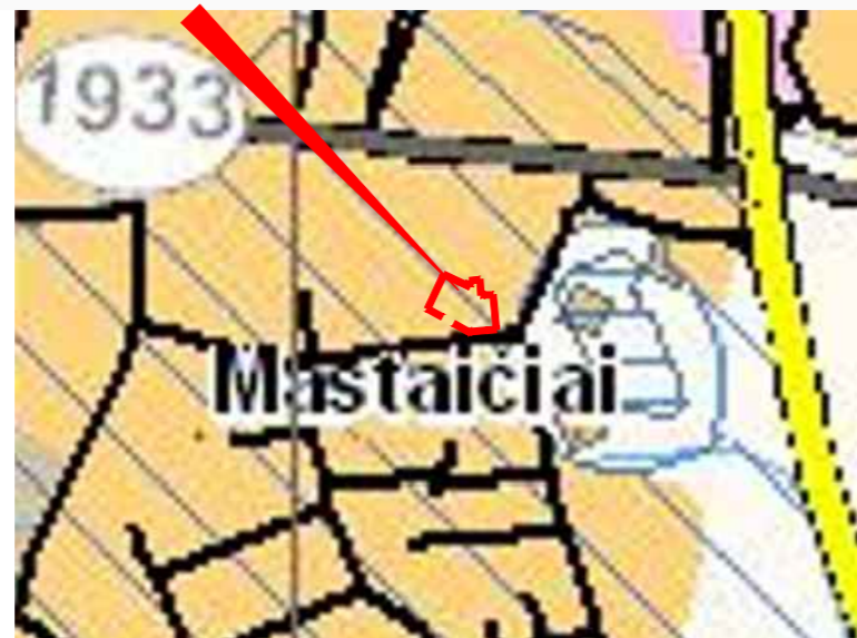
Zemės naudojimo ir apsaugos reglamentai Ištrauka iš Kauno rajono sav. Bendrojo plano I-jo pakeitimo plano (T00073030, 2014-09-15)