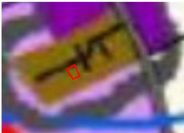
4 pav. ištrauka iš Kauno rajono savivaldybės teritorijos bendrojo plano I-ojo pakeitimo

Pagal Kauno rajono savivaldybės teritorijos bendrojo plano I-ojo pakeitimo sprendinius, planuojama teritorija patenka į Esamas užstatytas teritorijas (U1) (žr. 4 pav.).