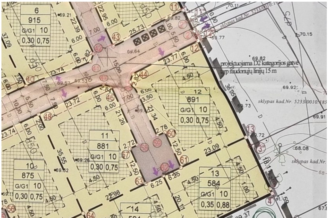
1 pav. ištrauka iš patvirtinto detaliojo plano

Leistinas užstatymo intensyvumas: iki 0,75