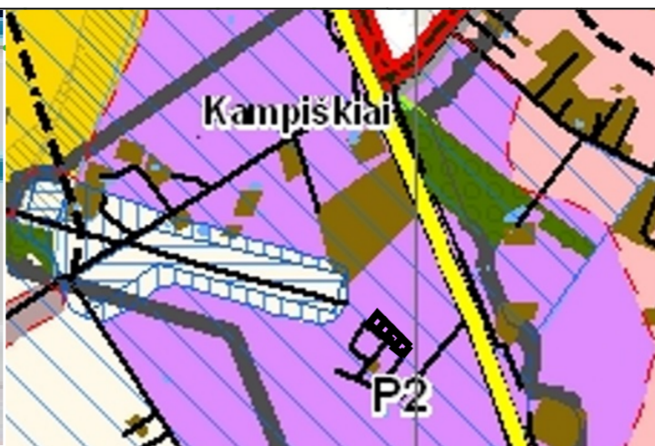
KAUNO SAV. TERITORIJOS BP II-ASIS KEITIMAS