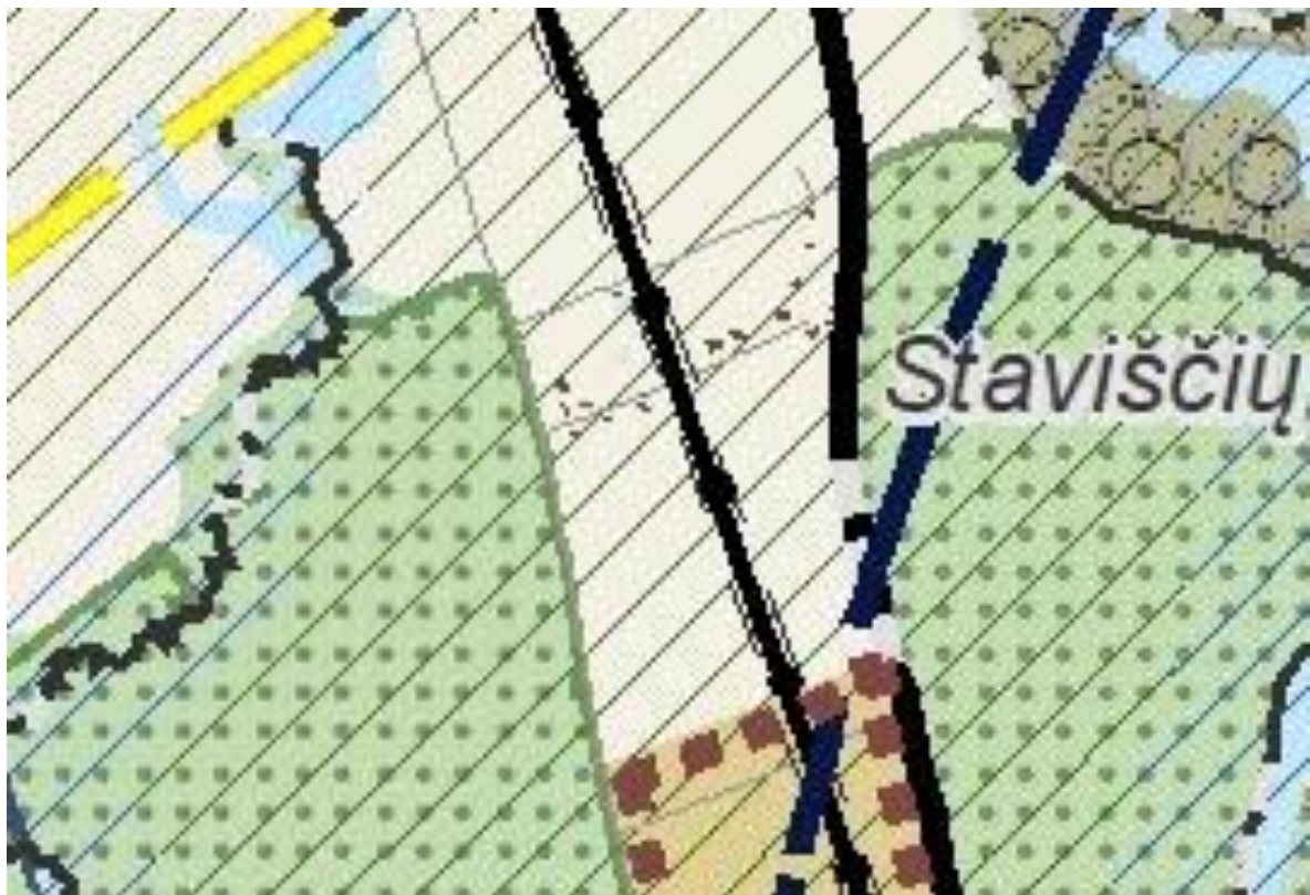
Ištrauka iš Kauno rajono savivaldybės teritorijos bendrojo plano 2-ojo keitimo

(6) – Jei funkcinėms zonoms taikomuose bendruosiuose tekstiniuose reglamentuose nenustatyta kitaip, vienbučio (vieno buto) ir dvibučio (dviejų butų) gyvenamojo pastato ar sublokuotų gyvenamųjų pastatų didžiausios leistinos žemės sklypų užstatymo reikšmės nustatomos pagal STR 2.02.09:2005 “Vienbučiai ir dvibučiai gyvenamieji pastatai”.