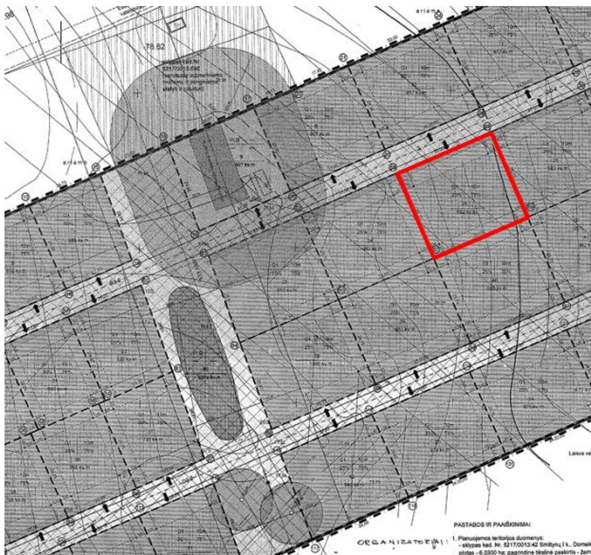
Ištrauka iš patvirtinto detaliojo plano