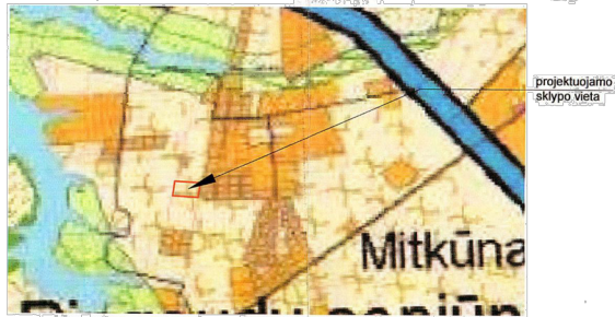
projektuojamo sklypo vieta