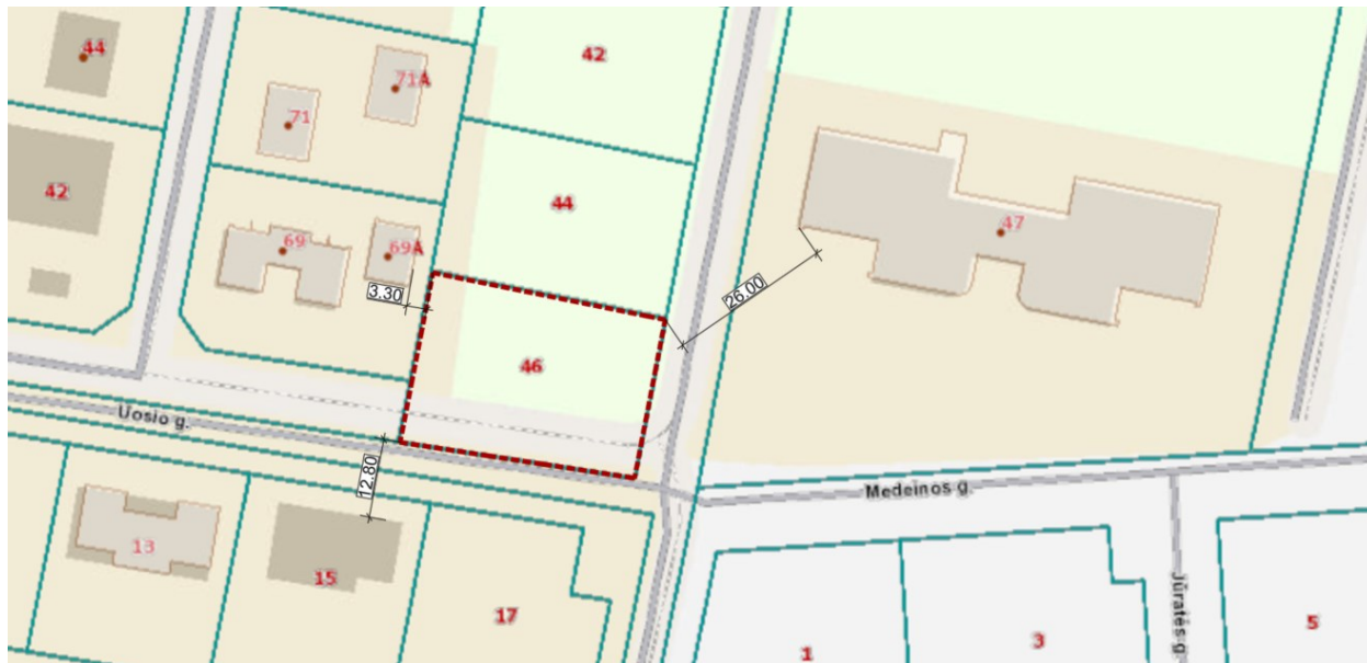
5 pav. Planuojamos teritorijos schema

Planuojama teritorija yra prie Slėnio/Uosio (Elnio) gatvių sankirtos. Teritorijoje vyrauja sodybinis užstatymas. Už Slėnio gatvės, rytinėje planuojamos teritorijos dalyje yra vaikų darželis. Artimiausios suplanuotos gyvenamosios teritorijos, su kuriomis ribojasi planuojama teritorija: vakarinėje pusėje adresu Elnio g. 69A 3,3 m atstumu, pietinėje su sklypu adresu Uosio g. 15 – 12.8 m atstumu, su visuomenine teritorija (vaikų darželiu) – 26 m atstumu. (žr. 5 pav.).