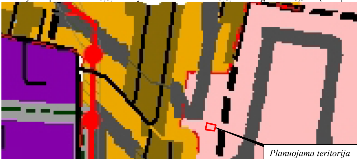
2 pav. Situacijos schema iš Kauno rajono savivaldybės teritorijos bendrojo plano I-ojo pakeitimo korektūros

Žemės ūkio. Konservacinės paskirties. Vandens ūkio. Užstatymo intensyvumas UI bendrajame plane – max. 0,6; užstatymo tankumas – max 0,8, aukštingumas – 8,5 m. (žr. 2 pav.)