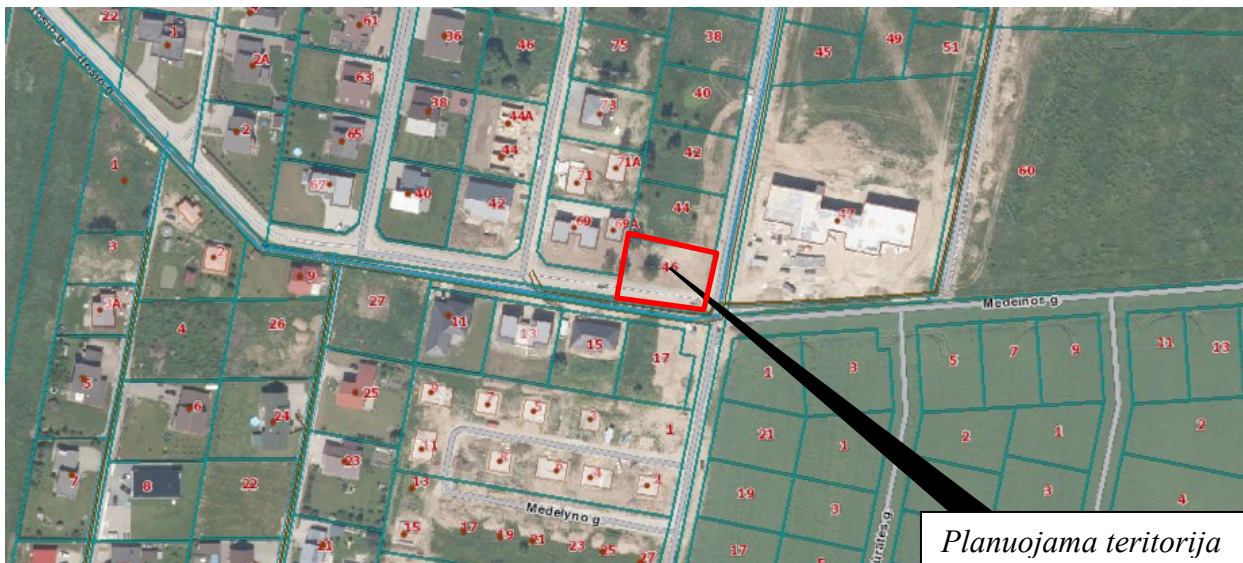
1 pav. Situacijos schema

Planuojami žemės sklypai yra Jonučių II k, Kauno r. Planuojamos teritorijos esamos padėties analizei atlikti panaudota topografinė nuotrauka, parengta 2024 m., žemės sklypo ir kiti nekilnojamojo turto kadastro ir registro VĮ Kauno filialo bei planavimo organizatoriaus pateikti duomenys. Planuojama teritorija apžiūrėta vietoje.