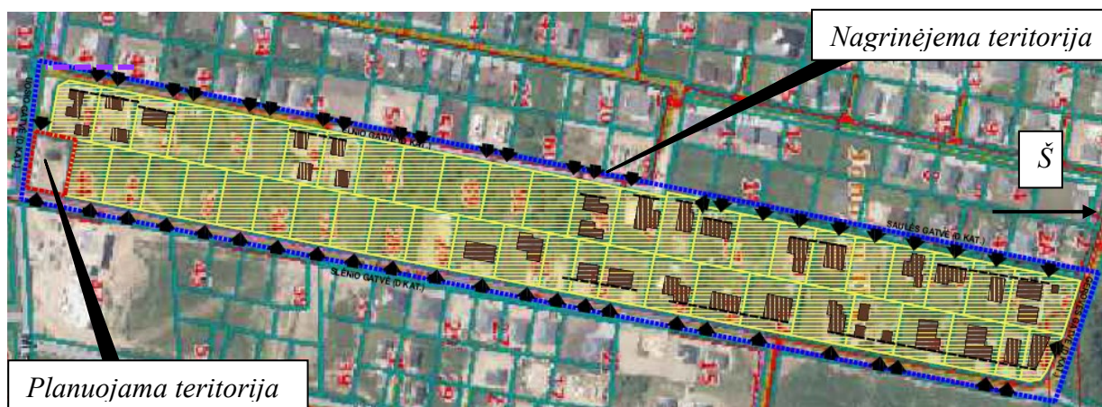
4 pav. Uosio/Slėnio gatvės užstatymas

Teritorijoje dominuoja gyvenamoji teritorija, sodybinis užstatymas. Nagrinėjamoje teritorijoje vyrauja vieno, dviejų aukšto pastatai. Žemės sklype Nr. 1 vykdamt susisiekimo komunikacijų plėtrą, užstatymo formavimo kvartale – neįtakos. (žr. 4 pav).