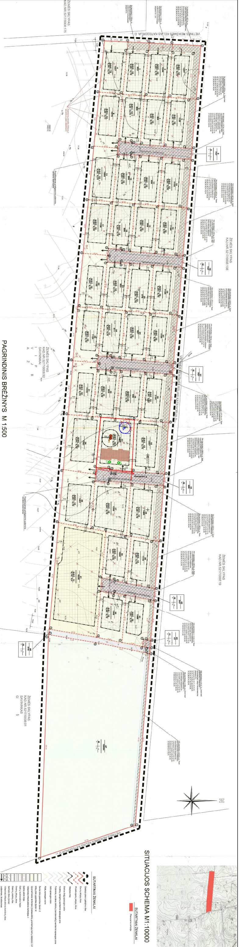
PAGRINDINIS BRĖŽINYS M 1:500