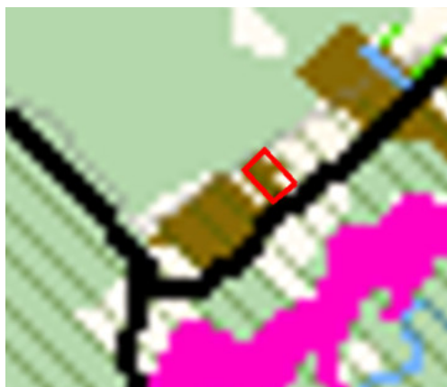
4 pav. ištrauka iš Kauno rajono savivaldybės teritorijos bendrojo plano I-ojo pakeitimo

Pagal Kauno rajono savivaldybės teritorijos bendrojo plano I-ojo pakeitimo sprendinius, planuojama teritorija patenka į U9 teritoriją ir gamtinio karkaso teritoriją - pavieniai statiniai ir jų grupės žemės ūkio teritorijose (žr. 4 pav.).