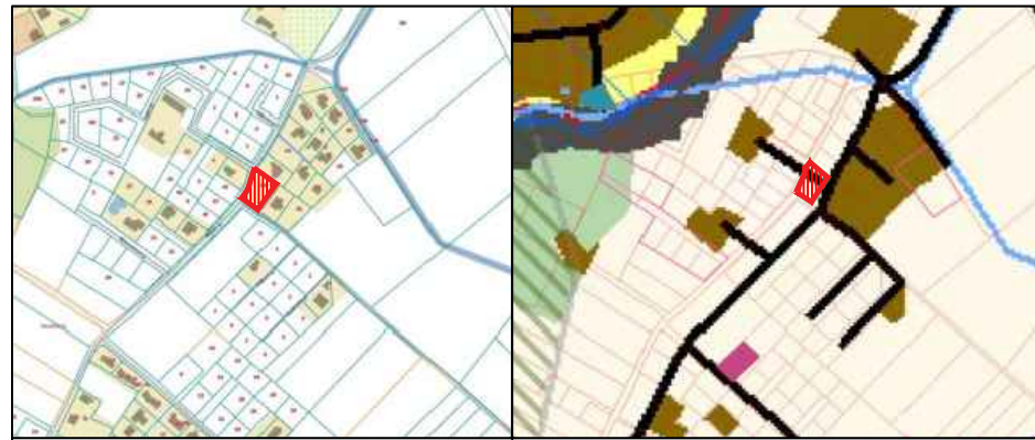
SITUACIJOS SCHEMA IŠTRAUKA IŠ KAUNO R. BP

DETALIOJO PLANO PAVADINIMAS: Kauno rajono savivaldybės tarybos 2006-04-27 sprendimu Nr. TS-82 patvirtinto žemės sklypo Kauno r. sav., Alšėnų sen., Mastaičių k., kadastro Nr. 5247/0012:283, detaliojo plano koregavimas žemės sklype Kauno r. sav., Alšėnų sen., Mastaičių k., Miglės g. 54, kadastro Nr. 5247/0012:593.