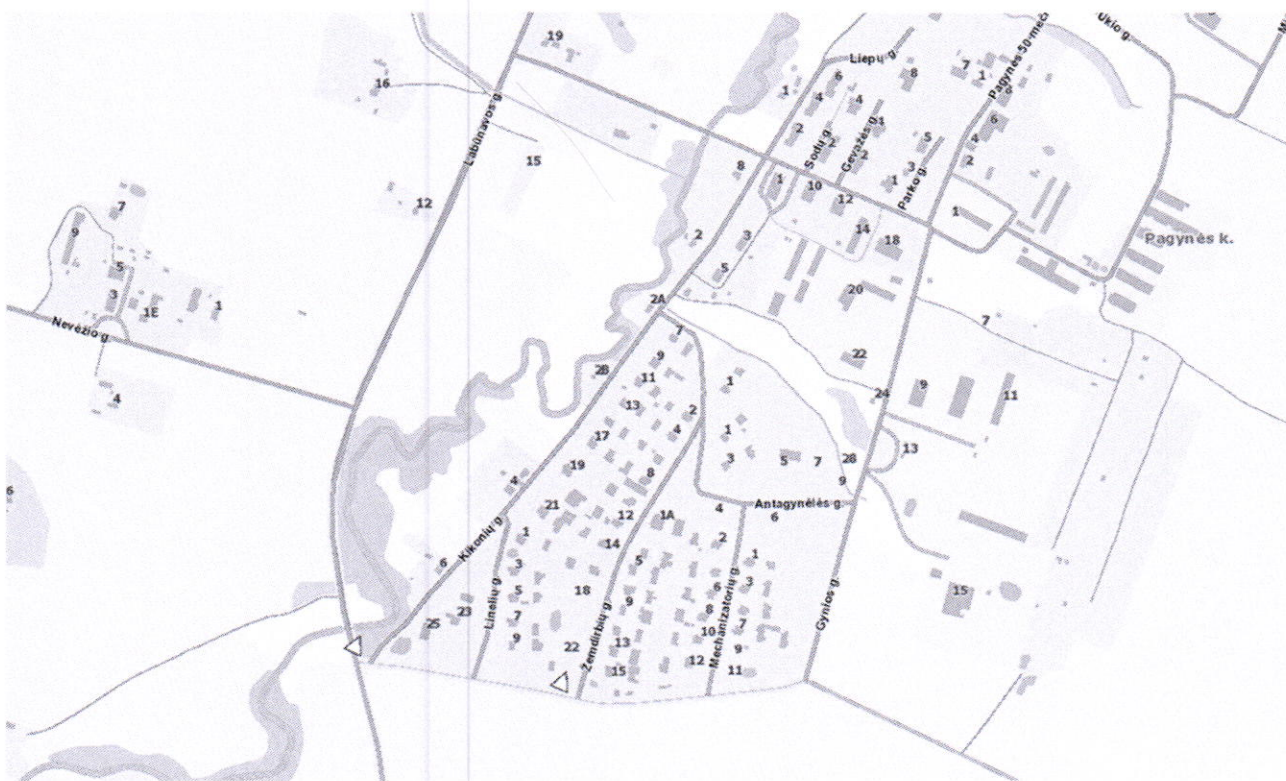
Ženkla Nr. 203 „Duoti keliai“