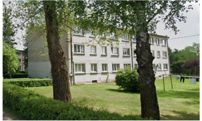
PATALPOS PATALPŲ PLANAS PO REMONTOS IR PASKIRTIE KEITIMO PAKEITIMO M1:100