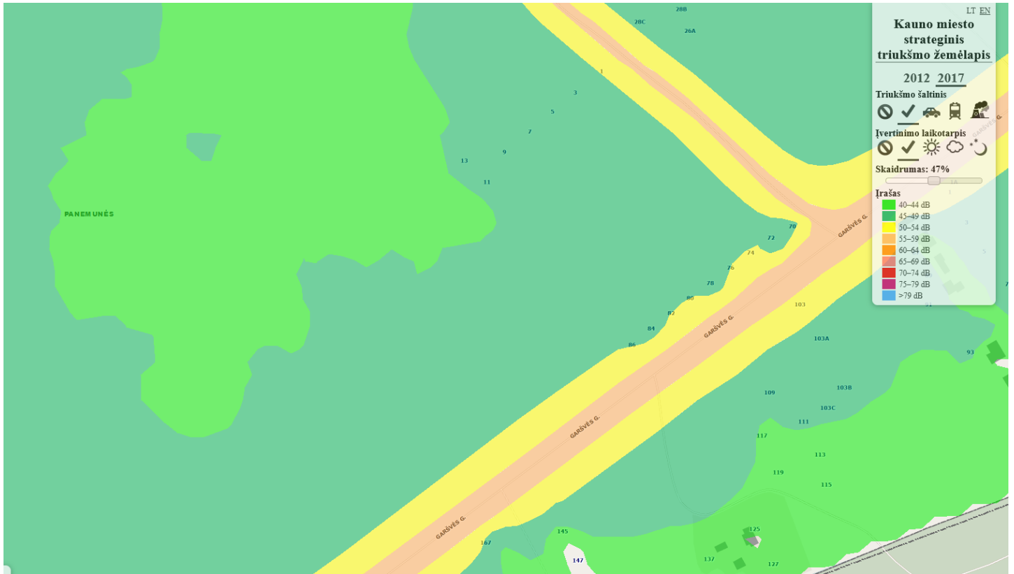
Teritorijos triukšmo žemėlapis