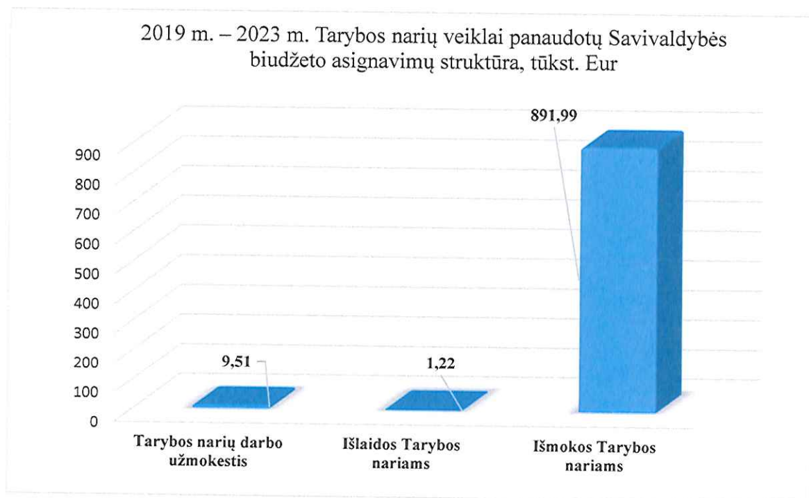
2 pav. Tarybos narių veiklai panaudotų biudžeto asignavimų pasiskirstymas, tūkst. Eur.