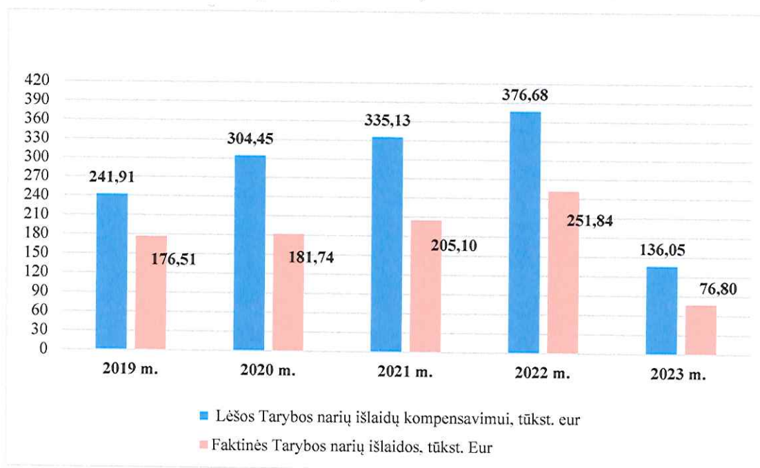
1 pav. Tarybos narių veiklos finansavimas

Šaltinis – Savivaldybės administracijos Buhalterinės apskaitos skyrius