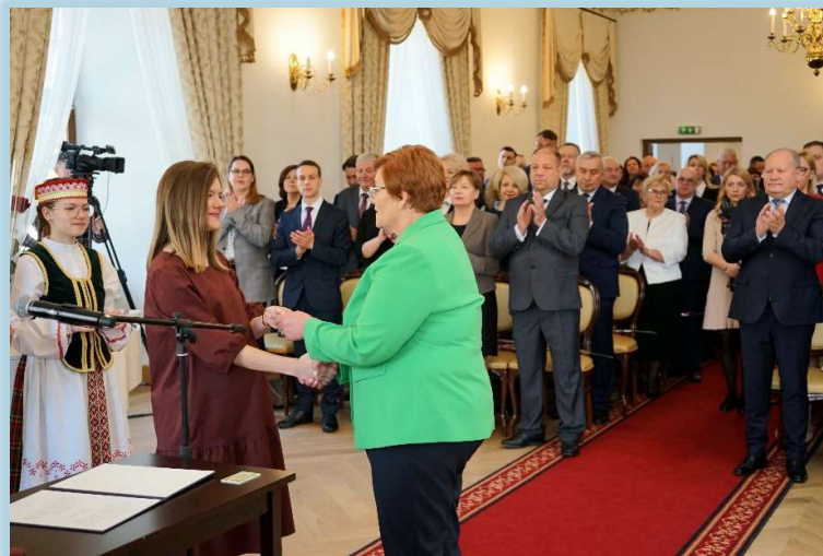
Pirmasis 2023-2027 m. kadencijos Tarybos posėdis.

Pagal Vietos savivaldos įstatymo 17 straipsnio 23 punktą 2023 m. rugsėjo 28 d. kartu su Liberalų sąjūdžio frakcija organizavome savivaldybės tarybos mažumos valandą. Jos metu mažumos atstovai turi teisę užduoti klausimus merui, vicemerams, administracijos direktoriui, komitetų, komisijų pirmininkams ir gauti atsakymus. Uždaviau klausimus dėl greitosios medicinos pagalbos tarnybos pertvarkos – Kauno rajono stočių perdavimo nacionalinei tarnybai išsaugant darbuotojus ir užtikrinant paslaugos kokybę Kauno rajono gyventojams.