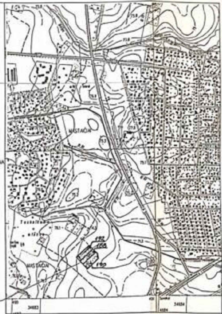
SKLYPO SITUACIJOS SCHEMA