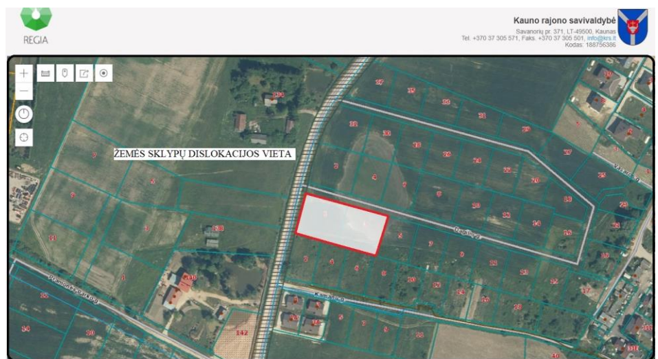
FRAGMENTAS IŠ www.regia.lt

Sklypų reljefas nekeičiamas. Sklypų ribose nėra saugotinių medžių ar krūmų. Šiaurinėje sklypų dalyse yra servitutinis kelias. Sklype statinių nėra.