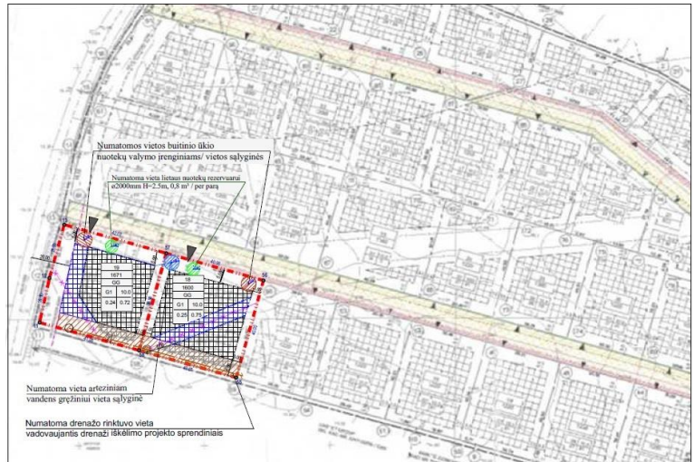
FRAGMENTAS IŠ PATVIRTINTO DETALIOJO PLANO SPRENDINIŲ

Detaliojo plano "Esamo sklypo Jonučių k. (reg.nr.52/25634) paskirties keitimas iš žemės ūkio į kitą (gyv. teritorija) ir padalijimas į 36 sklypus, o taip pat statybos reglamentavimas", sprendiniais patvirtintais Kauno rajono savivaldybės tarybos sprendimu, buvo suformuoti 36 sklypai. Šiuo detalioju planu atliekamas dviejų sklypų Sklypas 18 – 1600 m 2 , Sklypas 19 – 1671 m 2 , sprendinių koregavimas techninio darbo projekto metu, padidinant užstatymo zoną ir parenkant vandens gręžinio vietą sklypuose, nekeičiant pagrindinių reglamentų.