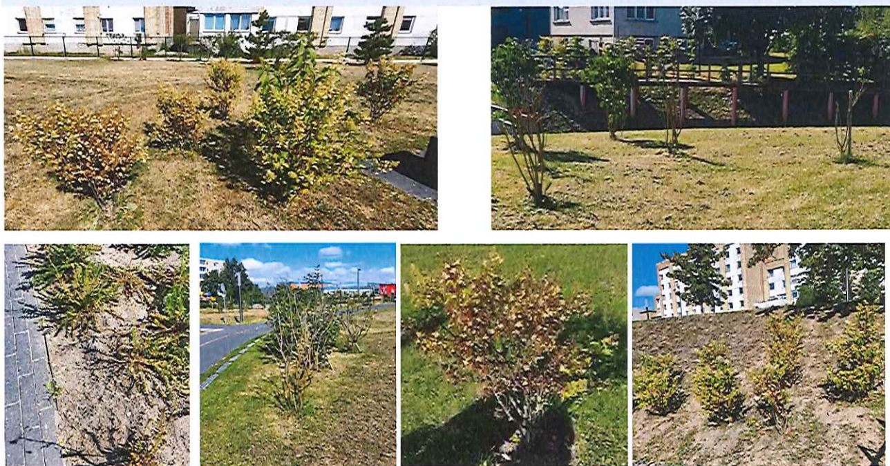
Kaimynystės parke esančių augalų pavyzdžiai

Po lietaus žolė ir dalis augalų sužaliavo.