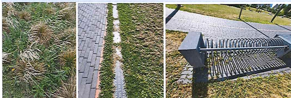
Nesutvarkytų želdinių ir takų pakraščių pavyzdžiai

Audito metu, informavus Seniūną, želdiniai ir pasivaikščiojimo takų pakraščiai buvo išravėti.