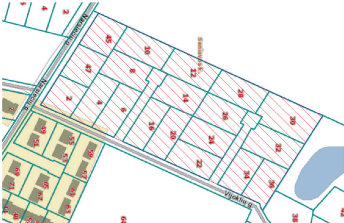
Sklypų schema.

Analizei naudota topografinė nuotrauka, žemės sklypo ribų planai, nekilnojamo turto registro išrašai.