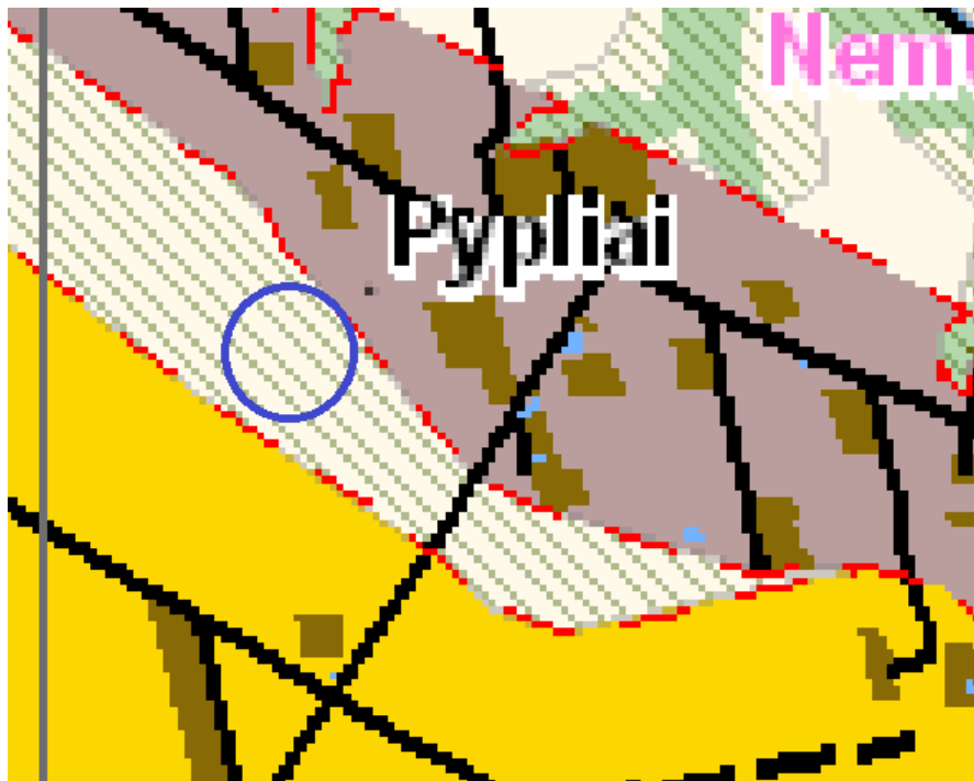
4 pav. ištrauka iš Kauno rajono savivaldybės teritorijos bendrojo plano I-ojo pakeitimo

Pagal Kauno rajono savivaldybės teritorijos bendrojo plano I-ojo pakeitimo sprendinius, planuojama teritorija patenka į Žemės ūkio teritorijas (žr. 4 pav.) ir į gamtinio karkaso teritorijas (žr. 4 pav.).