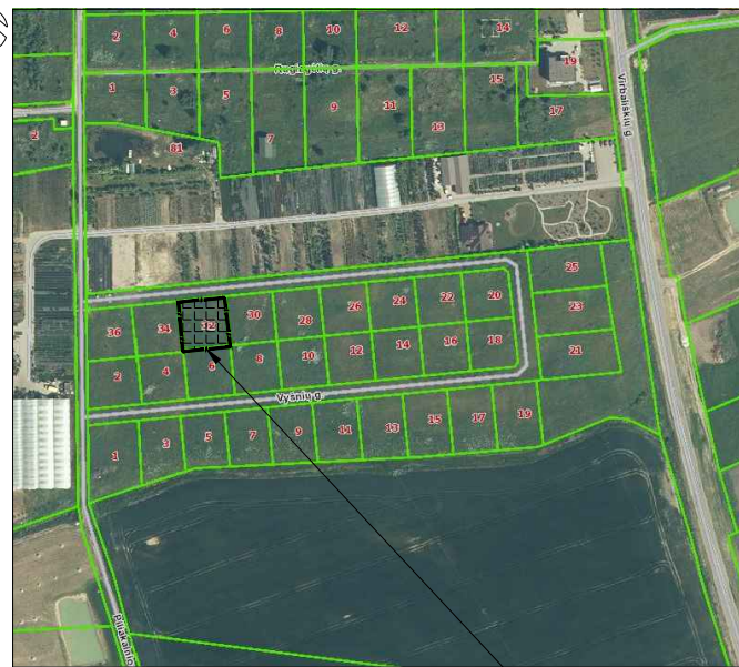
SITUACIJOS SCHEMA OBJEKTO VIETA