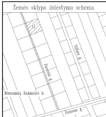
TOPOGRAFINIS PLANAS M 1:500