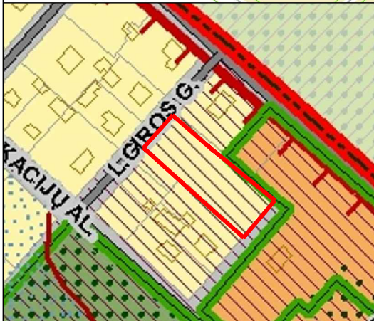
BENDROJO PLANO IŠTRAUKA