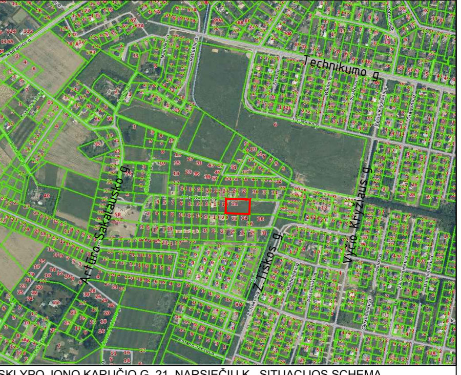
SKLYPO JONO KARUČIO G. 21, NARSIEČIŲ K., SITUACIJOS SCHEMA