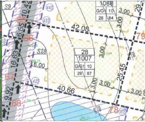
IŠTRAUKA IŠ GALIOJANČIO DP