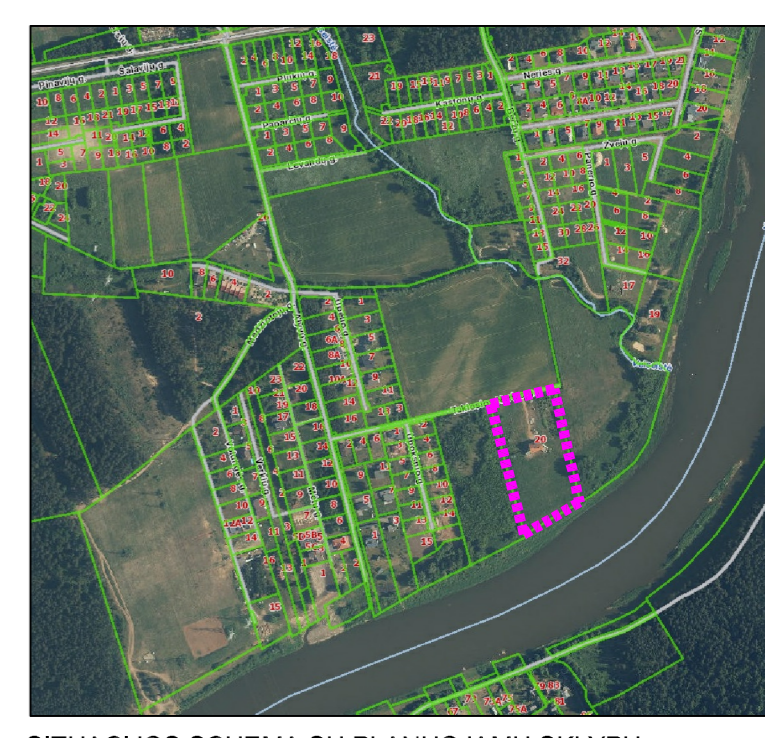
SITUACIJOS SCHEMA SU PLANUOJAMU SKLYPU