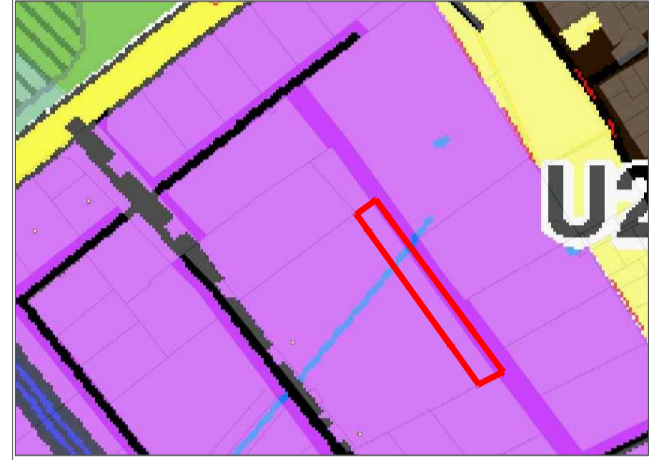
BENDROJO PLANO IŠTRAUKA