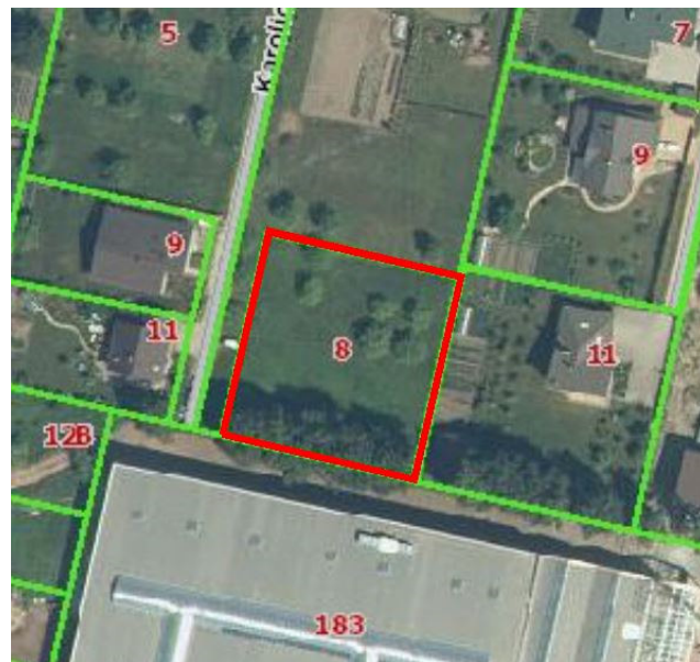
Kadastro žemėlapis ištrauka

Pietinėje pusėje sklypas ribojasi su žemės sklypu Kauno r. sav., Alšėnų sen., Narsiečių k., Vytauto g. 183, kad. Nr. 5247/0009:141. Plotas: 2.5158 ha. Paskirtis: Kita; naudojimo būdas: Komercinės paskirties objektų teritorijos.