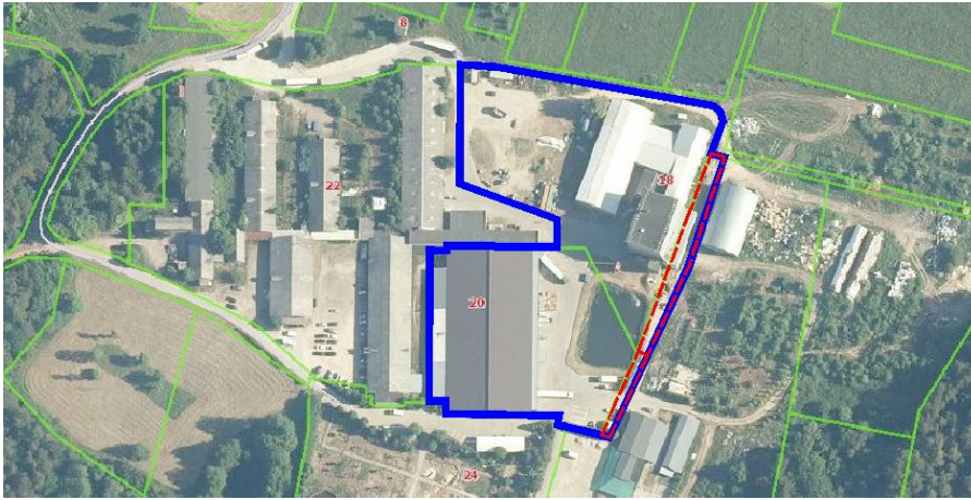
Planuojama teritorija Formuojami įsiterpę valstybinės žemės sklypai M 1:4 000