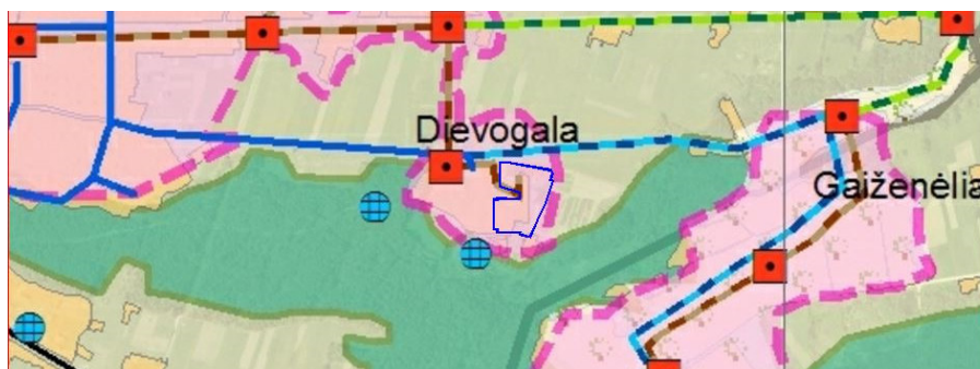
Planuojama teritorija M 1:20 000

1. Kauno rajono savivaldybės vandens tiekimo ir nuotekų tvarkymo infrastruktūros plėtros specialusis planas, patvirtintas KRS tarybos 2008-11-20 sprendimu Nr. TS-385.