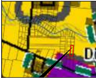
PLANUOJAMA TERITORIJA SITUACIJOS SCHEMA (KAUNO R. SAV. TERIT. BP I-OJO PAKEITIMO KONTEKSTE)